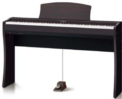
CL26 Palissandro Premium