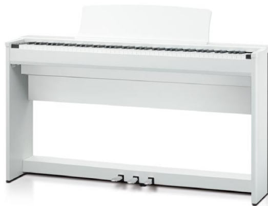
CL36 Bianco Satinato Premium